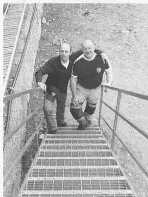
Inizia il banchetto